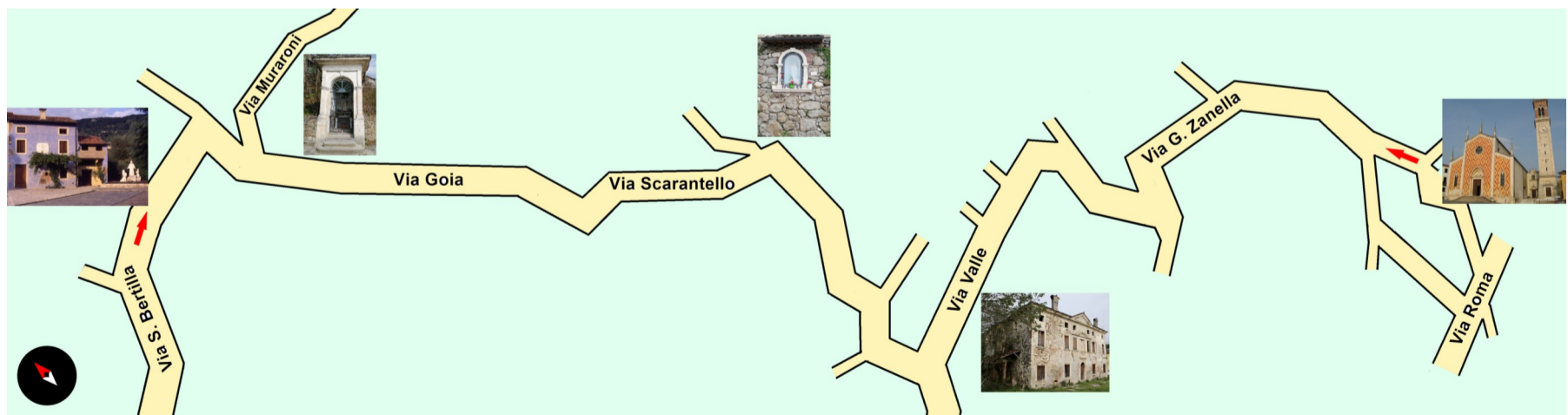
Villa Valle (Casavalle)