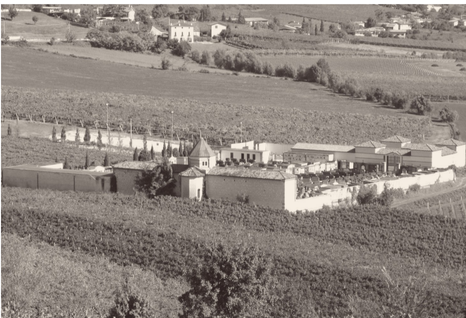
Cimitero di Brendola

A Montecchio Maggiore nasce il primo stabilimento per l'allevamento del baco da seta. Anche a Brendola si inizia l'allevamento del prezioso bruco. Si tratta di un'attività redditizia, ma faticosa. Richiede una cura costante, dalla raccolta delle foglie di gelso al controllo costante della temperatura e dello stato dei bruchi.