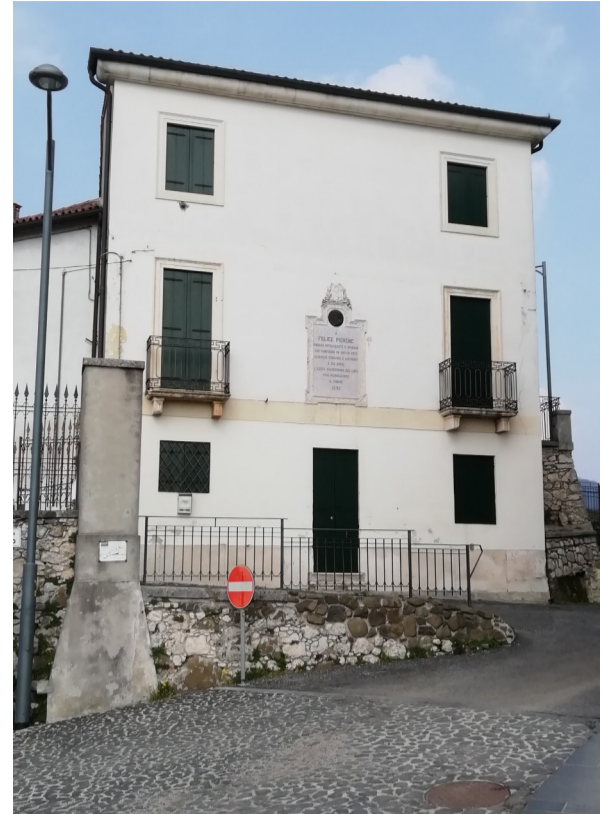
Casa della dottrina (Ex scuole elementari)