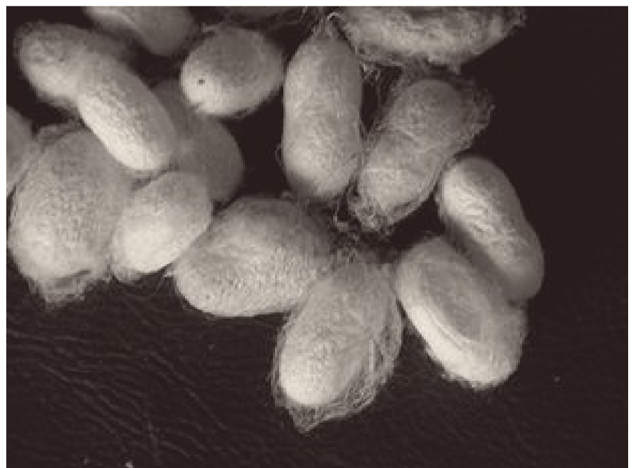
Bozzoli di baco da seta

In Brendola there are many small landowners who cannot support their families, because of the small extent of their farmlands. Therefore, they are forced to go to work for the rich landowners. In 1895 the cemetery of San Vito is built and in the same year the one in the main village is enlarged.